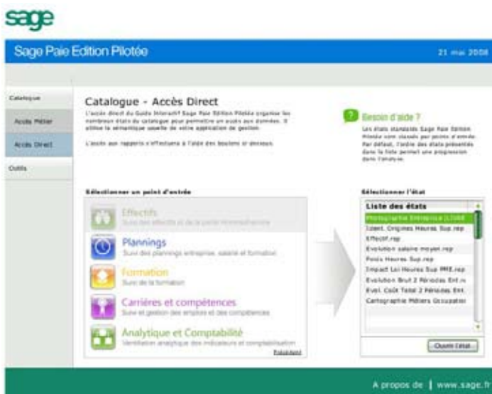
Bénéficiez d'un accès direct à vos tableaux de bord