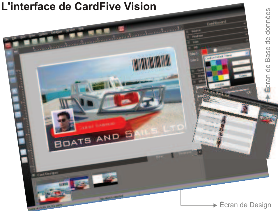
Écran de Base de données